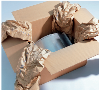
▪ Este & tuki