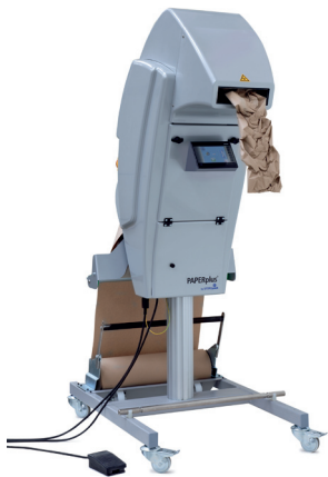
PAPERplus® Classic 2