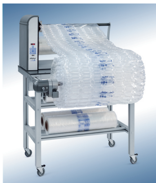
AIRplus® GTI XL

Toimintaprofiili: nopea, pienikokoinen ja aina käyttövalmiina