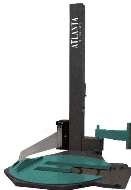
Myös TP-Mallina (Avopöydällä)